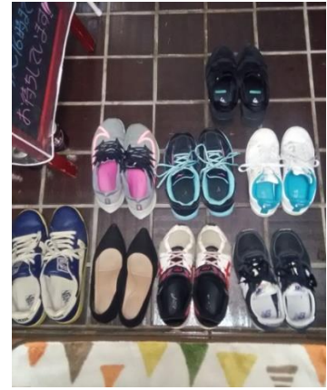
今年も一年ありがとうございました。 来年もよろしく願いいたします。

彼女だったんだ。私はその場で、揃えてくれてありがとうと言ったら、さっと階段をかけ上がって、2階に行ってしまいました。何て素敵な光景を見られたのだろうと心が、ホッコリとしました。